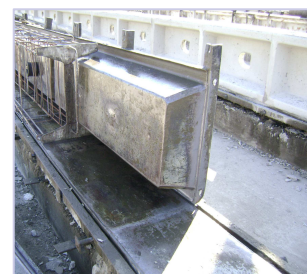
Moldes de postes