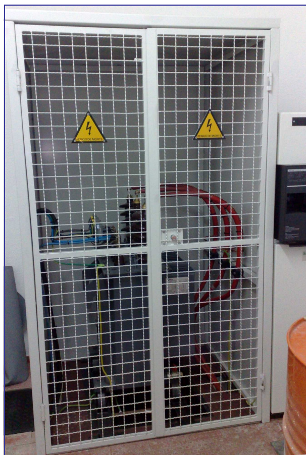
Aspecto final da Cella do Transformador e Celas MT