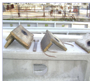
Encaixe para almofada do poste