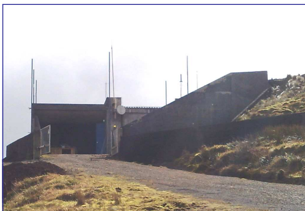
Vista geral do PT do VOR/DME onde decorreram os trabalhos

Salienta-se ainda a adjudicação à Pinto & Bentes dos trabalhos da Remodelação do PT do VOR do Rádio Farol da Ilha da Madeira, na Ponta de S. Lourenço, pela NAV Portugal.